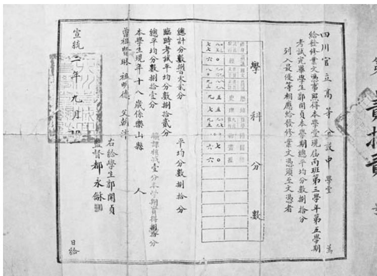
1910年郭开贞在成都高等分设中学堂的修业文凭