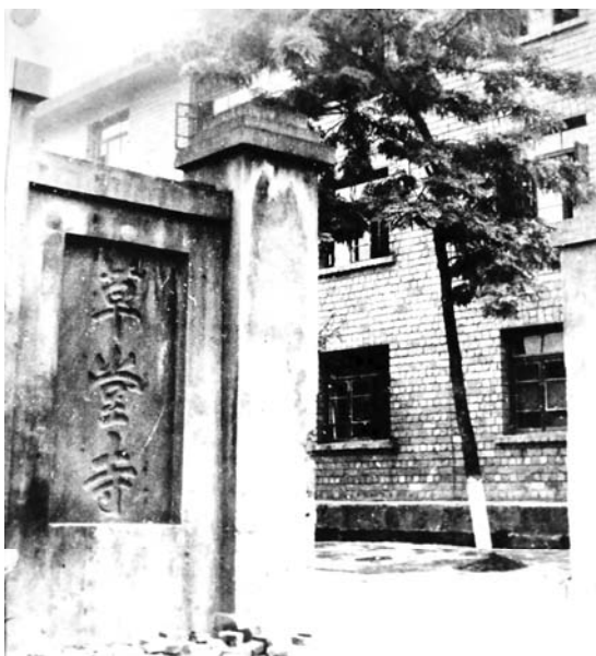
1905—1907年郭开贞曾在此读书。图为原乐山县高等小学堂旧址