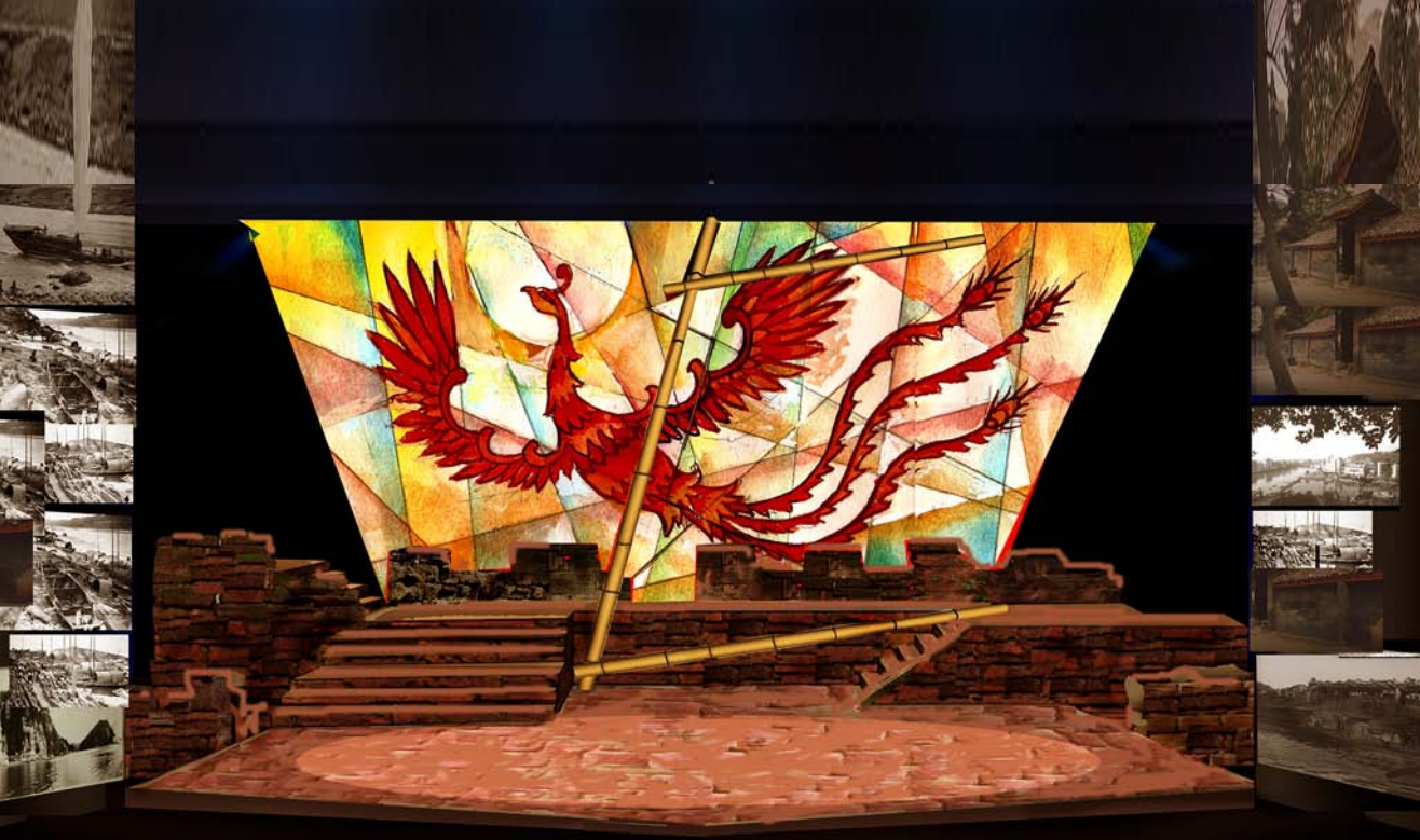
▲ 舞美效果图一 薛殿杰