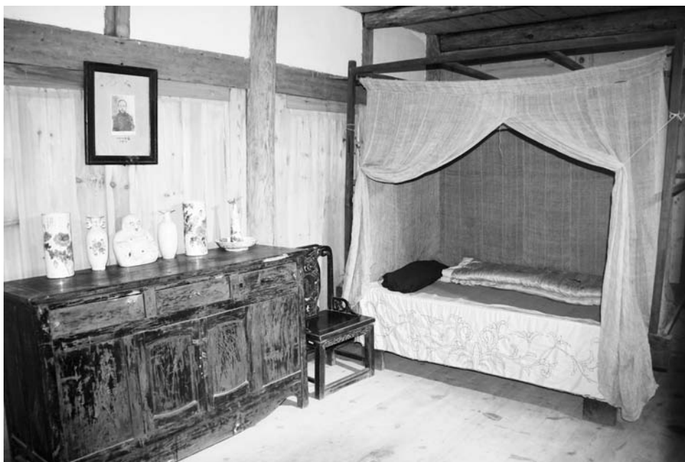
郭开贞诞生室（1892年11月16日郭开贞诞生于这个不足14平方米的房间）