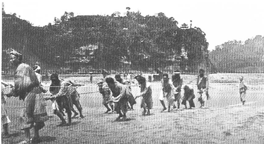
20世纪初岷江畔的纤夫