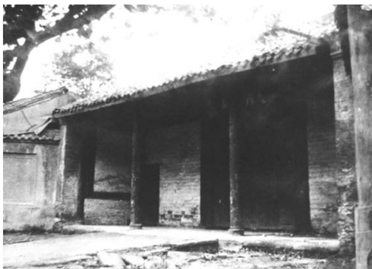
1910—1912年郭开贞在成都高等分设中学堂读书。图为该校大门