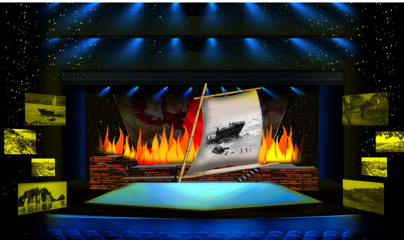
▼ 舞美效果图二 薛殿杰