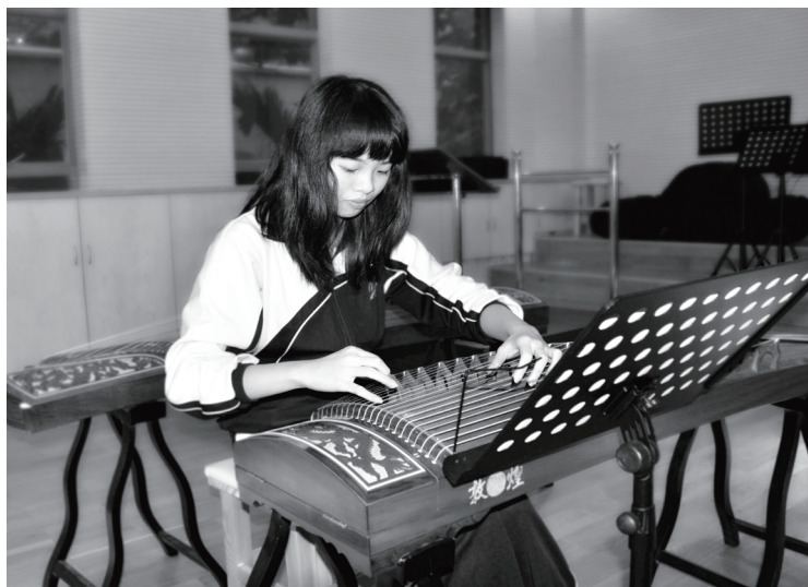
高三那年，练琴是休息的方式之一