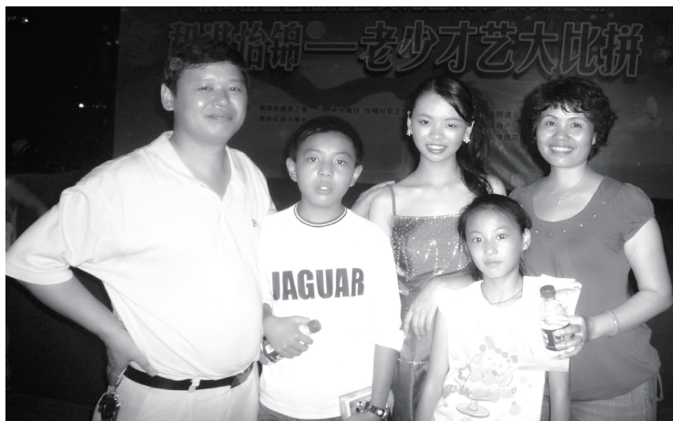
十二岁主持晚会，与爸爸妈妈弟弟妹妹合影