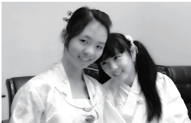
和妹妹洋洋是永远的死党