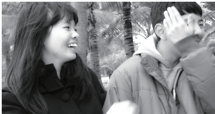
偶尔欺负一下小牛弟弟真开心